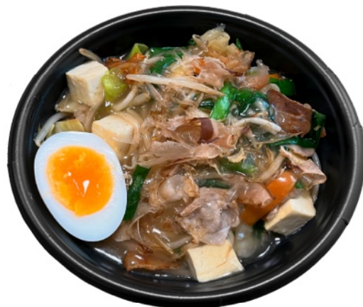
あんかけマーミーナー炒め丼 700円