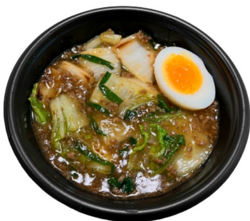
そばろ白菜あんかけ丼 700円