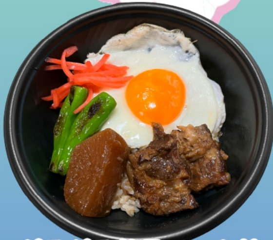
ぷるぷる軟骨ソーキ丼