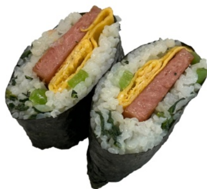
日替わりおむすび 200円

これらのレギュラーメニュー以外に、店長が急に食べたくなったら「おうちの ポークカレー丼」とか「とり唐揚げ丼」、「クリスマススペシャル丼」等々が 登場するかも。無料でスープがついてくる日もあります。 お楽しみに！