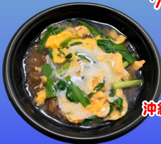
沖縄ちゃんぽん丼

運転して移動中のときや、接客中 などで、電話に出られないことが あります。ご了承ください。