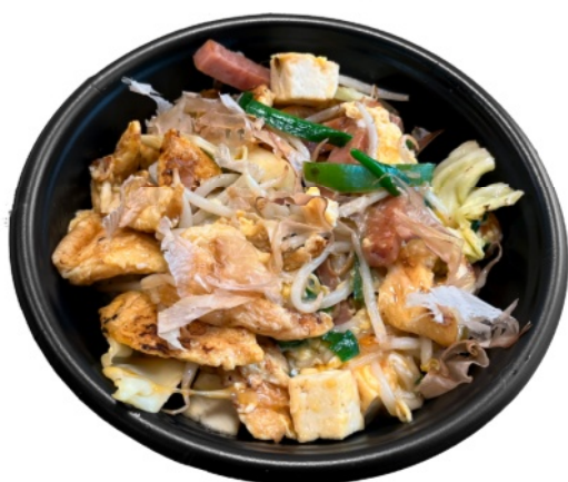
ふーちゃんぷるう丼 700円