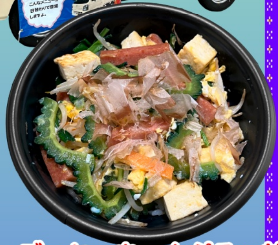
ゴーヤーちゃんぷるう丼