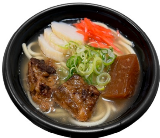
ぷるぷる軟骨ソーキそば 700円